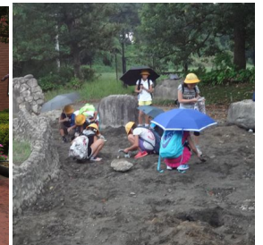
貴重な体験で、とても充実した1日となりました。