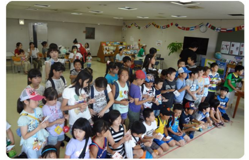
最後は全員でビンゴをやりました。